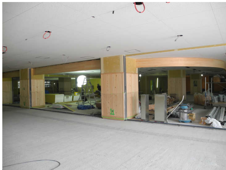
1階 内装工事（市民課窓口） 7月