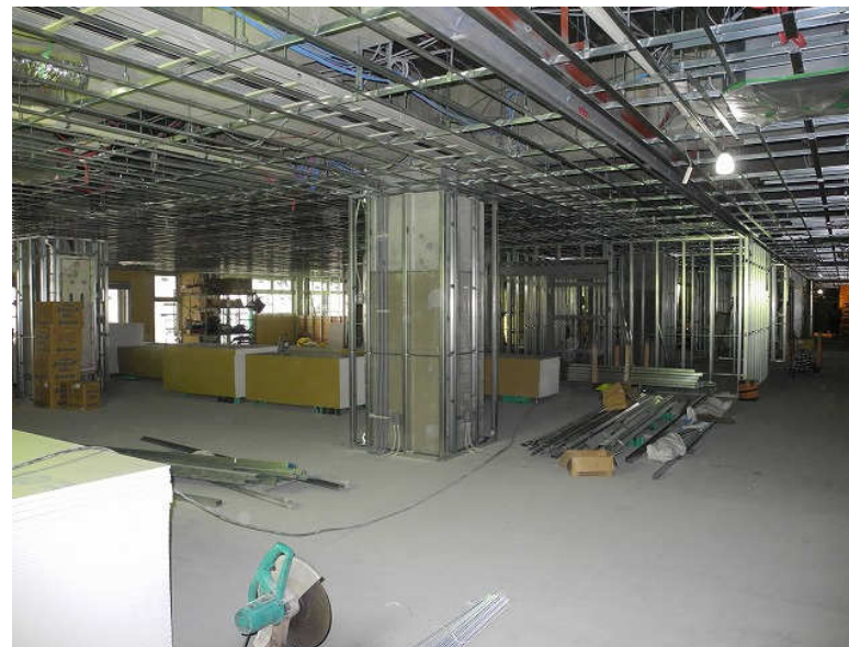
2階 内装工事（電気・機械設備、間仕切） 8月