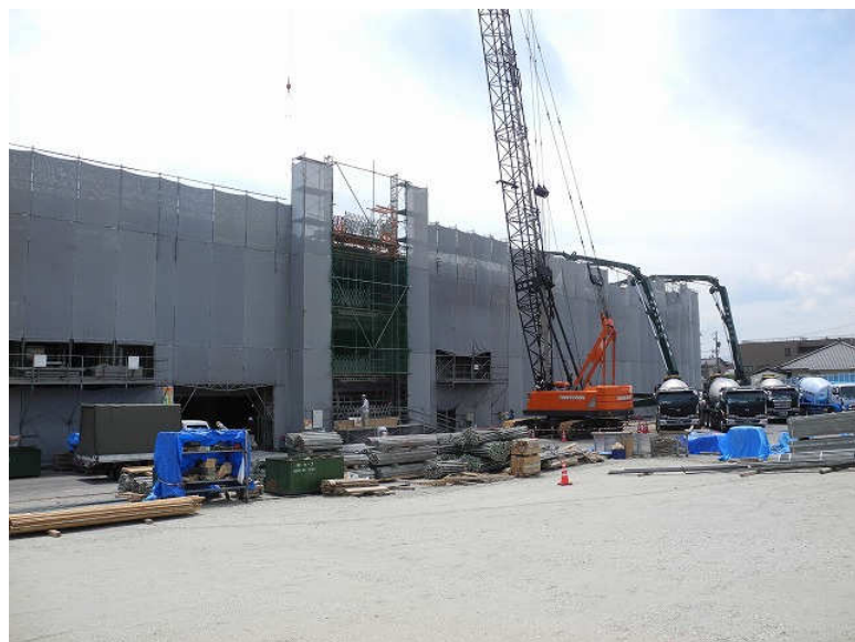
3階躯体 コンクリート打設工事 6月