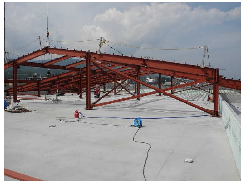
屋上 置屋根鉄骨工事 7月