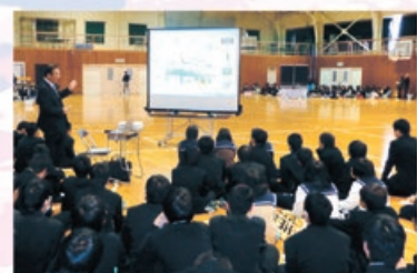
地元産業や地元事業所などへの 理解を深める説明会