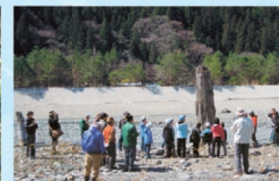
約1300年前の大地震により埋もれた 遠山川の埋没林について学ぶ小学生