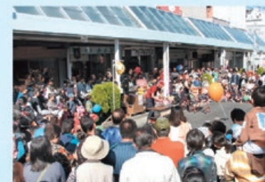
次世代や商店街が主体となって取り組む まちなか活性化イベントの開催