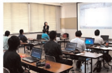
働きながら学ぶ 飯田産業技術大学講座