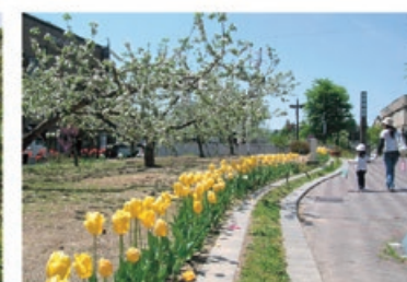
子どもと一緒に飯田に住もう