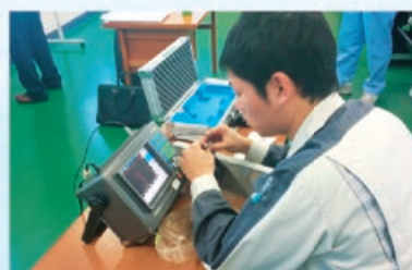
非破壊検査技術の習得と検査員資格の 取得に向けた超音波探傷試験