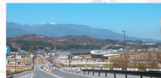
企業集積が進む天龍峡エコパレー