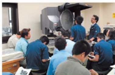
高精度製品に対応するための機器取扱研修