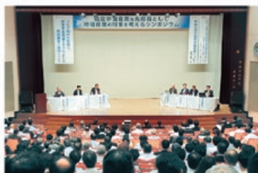
航空宇宙産業を先導役として地域産業の 将来を考えるシンポジウム