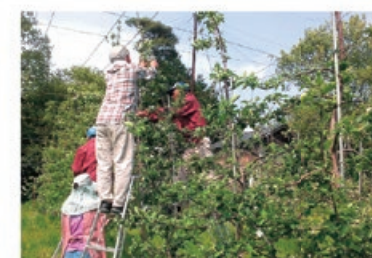
春のりんごの受粉作業