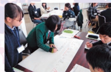
社会人になることへの不安解消や心構えを 身につけるための新社会人育成講座