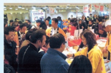
香港での若手農業者の販売チャレンジ