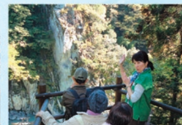
自然や植物探索、歴史散歩など 天龍峡ご案内人と楽しむ遊歩道散策