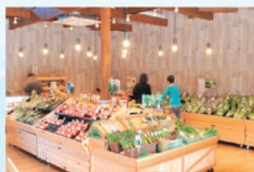
6次産業化対策事業交付金を活用した 南信州産の農産物直売所