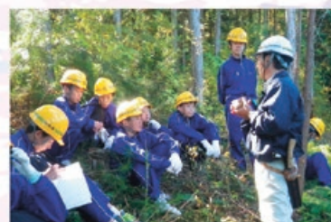
森林の大切さを知る森林環境教育