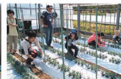
カーネーション農家で作業の手伝いをする 都会の若者