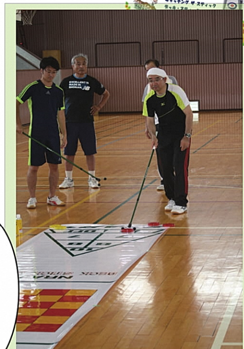
▲ デッキ・スティック・ゲーム