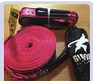
スラックラインの道具