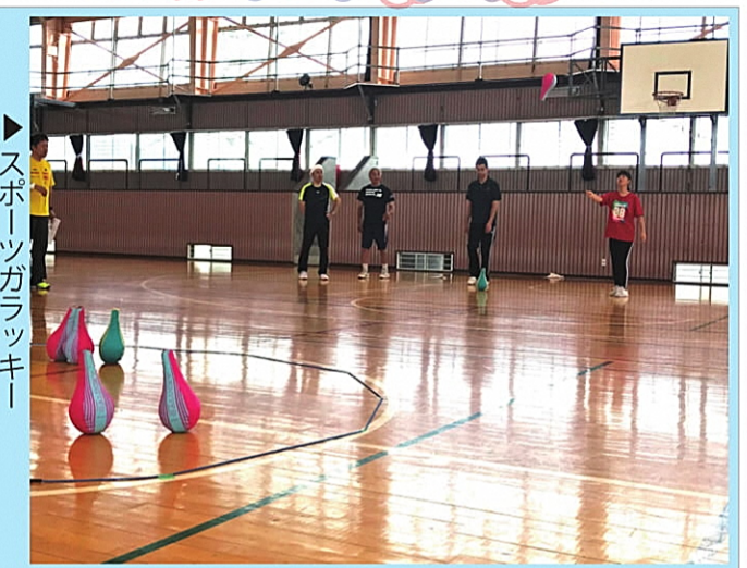
▶ スポーツガラッキー

ラダーゲッターとスポーツガラッキーは 段々と各地区の行事で利用されるよう なってきました！