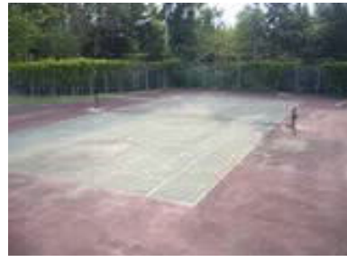
周辺施設(キャンプ場)