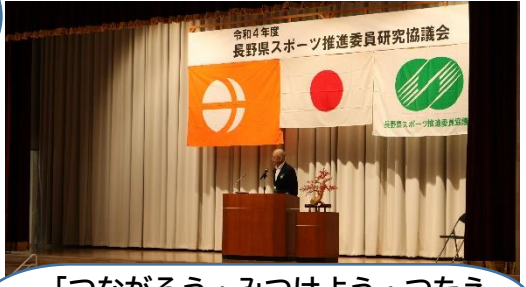
「つながろう・みつけよう・つたえよう。」を合言葉に開催されました。