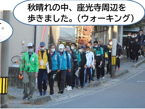
秋晴れの中、座光寺周辺を歩きました。(ウォーキング)