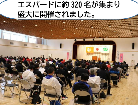
エスバードに約320名が集まり盛大に開催されました。

○ 令和4年10月29日（土）に、令和4年度長野県スポーツ推進委員研究協議会が飯田市（エスバード）で開催されました。 『「つながろう。みつけよう。つたえよう。」～新しい時代の 新しいスポーツの楽しみ方～』をテーマに、基調講演や分科会に分かれてのニュースポーツ体験が行われました。 長野県内から320名ほどのスポーツ推進委員や行政職員が集まり、大変貴重な交流の場となりました。