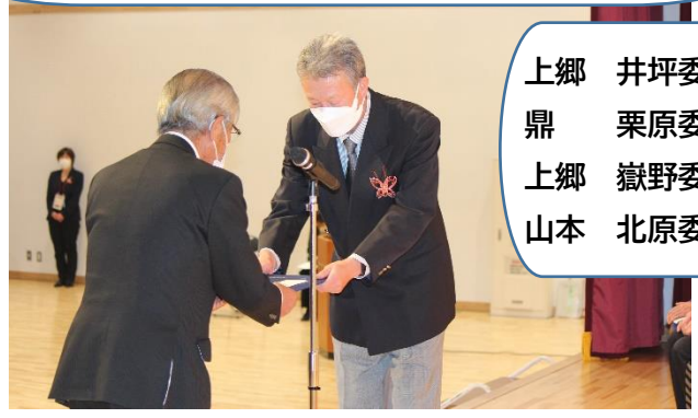
飯田市から4人の委員が、県の功労者表彰を受けました。