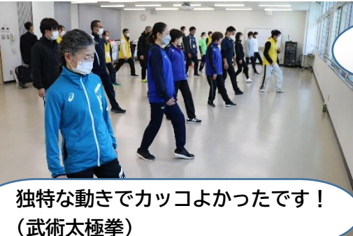
独特な動きでカッコよかったです！（武術太極拳）