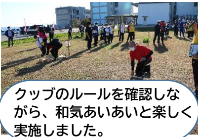
クップのルールを確認しながら、和気あいあいと楽しく実施しました。