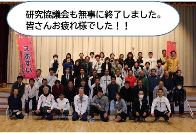
研究協議会も無事に終了しました。皆さんお疲れ様でした！！