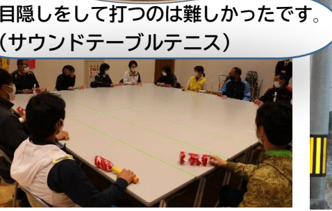
目隠しをして打つのは難しかったです。(サウンドテーブルテニス)