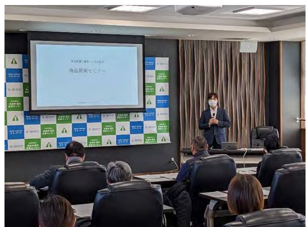
2/22 地域資源と顧客ニーズを結ぶ商品開発セミナー