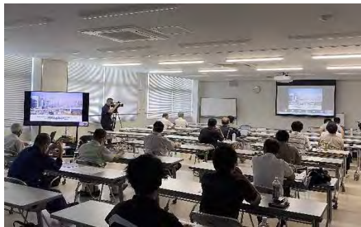
航空機電動化・次世代エアモビリティ事業 キックオフセミナー（6月28日）