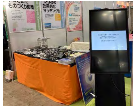
（テクニカルショウヨコハマ）