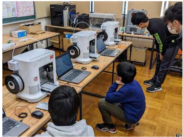
2/23 3Dプリンター操作講習会