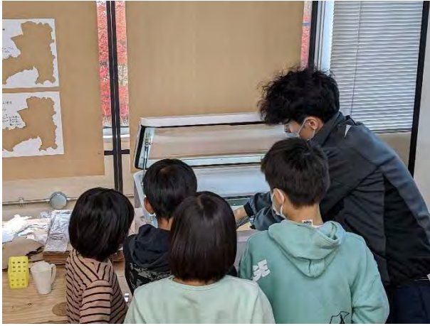
11/20 飯田市山本公民館育成部による 「地元を知ろうツアー」での見学・体験