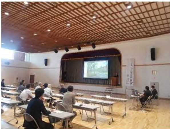
ランドスケープ・プランニング共同研究講座 6/9 コンソーシアム総会、講演会