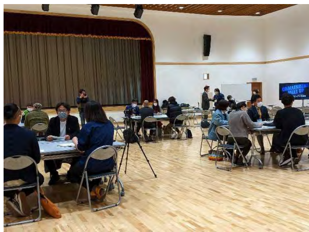
1/19 I-Port 起業家交流会