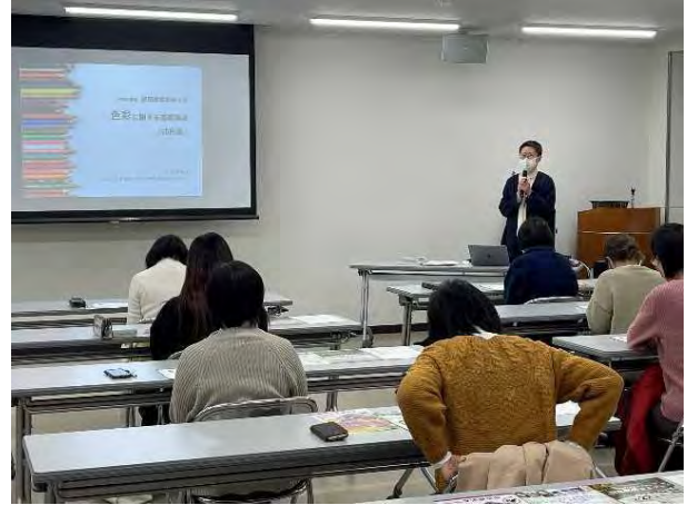
飯田短期大学連携講座