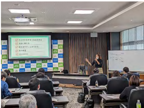
11/16・30 実践的マーケティングセミナー