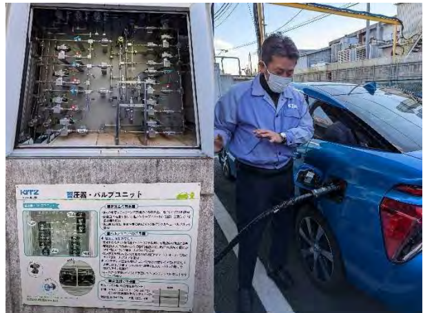
R4. 12. 19 水素エネルギー製品参入企業視察

https://www.instagram.com/hytrec_fukuoka/?hl=ja