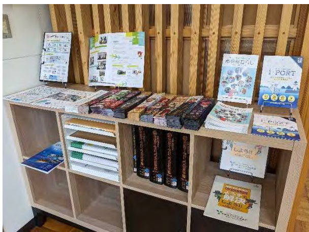
コワーキングスペースでの情報発信