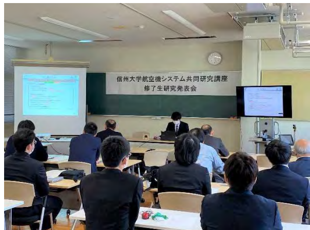
航空機システム共同研究講座 3/7 修了生研究発表会