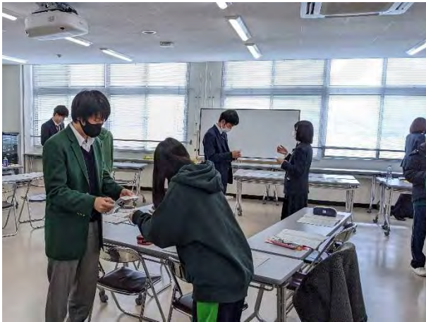
2/7・10・17・18 新社会人育成講座