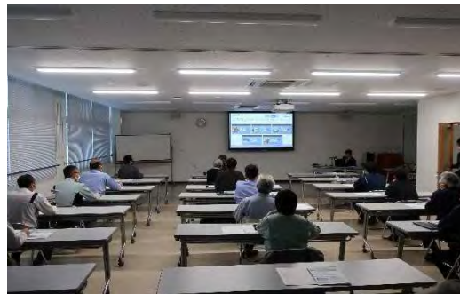
第1回航空機用モータ勉強会 （12月19日）