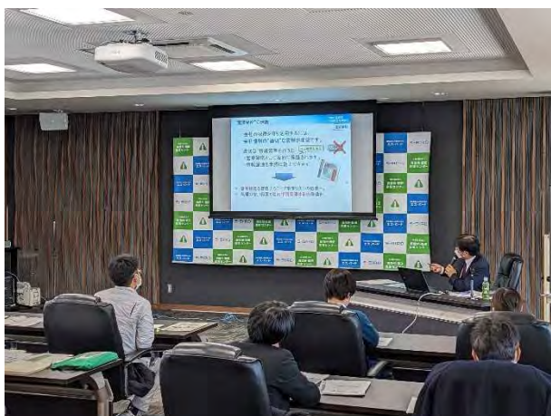
1/26 契約の基礎入門セミナー