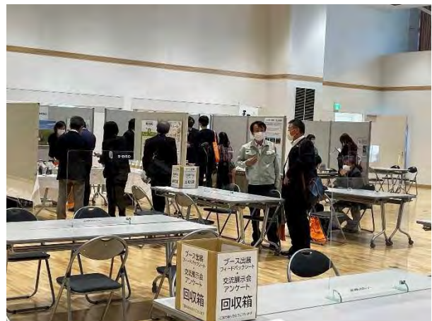
11/9 南信州地域資源交流展示会 2022 秋