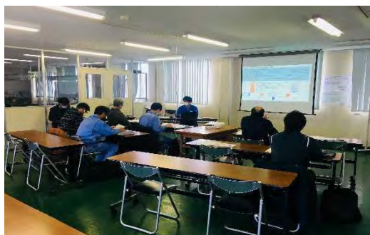
第1回3Dプリンタ勉強会（12月15日）