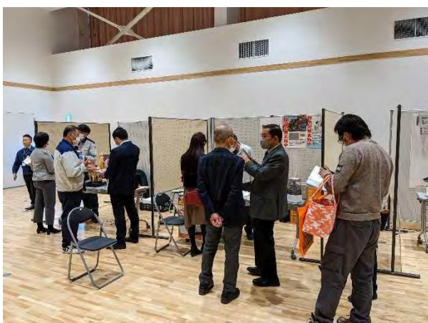
2/16 南信州地域資源交流展示会 2023 冬