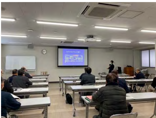
ルミナコイド研究会 R5. 1. 30 成果発表会