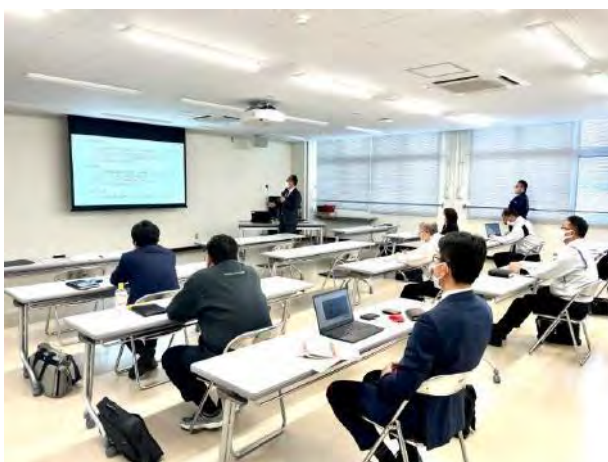
製造業 DX 推進ワーキンググループ