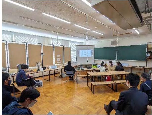
信州大学ジュニアドクター育成塾飯田会場 12/25 第1段階グループ研究発表会