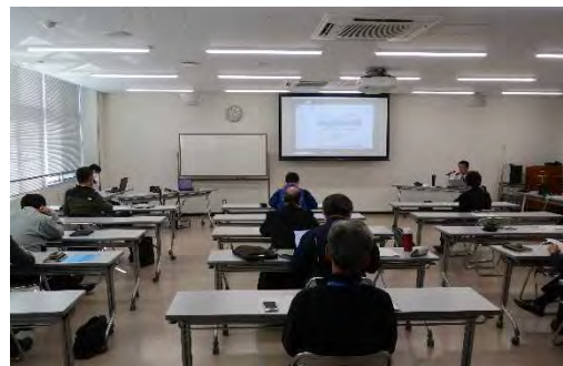
第1回センサ（アビオニクス）勉強会 （12月23日）