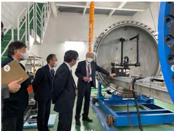
R4. 10. 31-11. 1 水素先進地福岡県視察

https://www.instagram.com/hytrec_fukuoka/?hl=ja