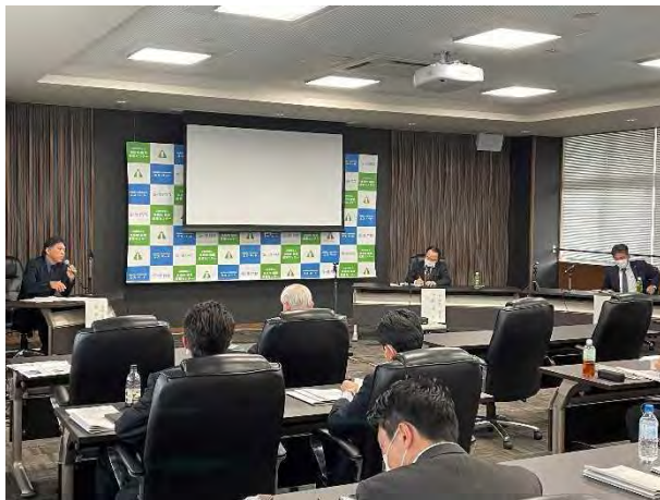
R5. 3. 8 水素エネルギー関連製品参入セミナー