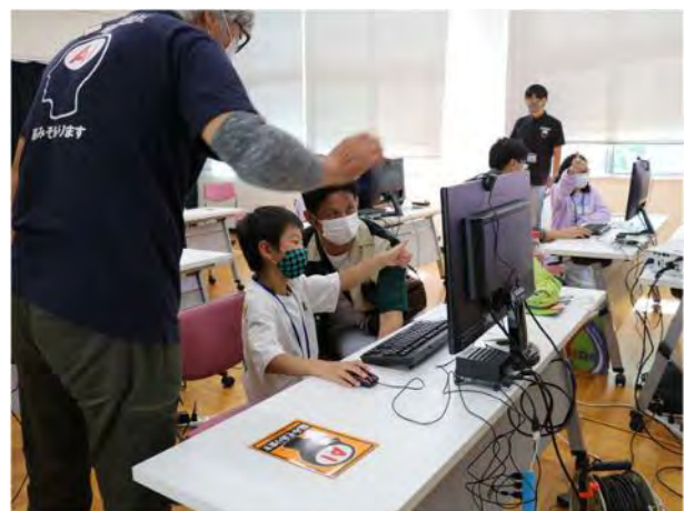
10/2「デジタルの日」に合わせた 飯田市デジタル推進課「デジタル体験会」