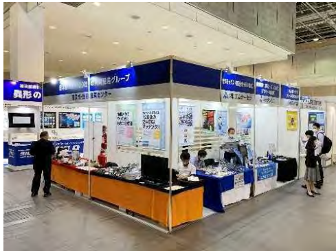
（関西機械要素技術展）