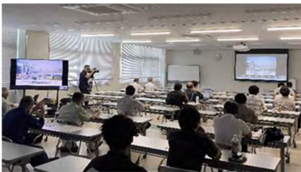
航空機電動化・次世代エアモビリティ事業 R4. 6. 28 キックオフセミナー