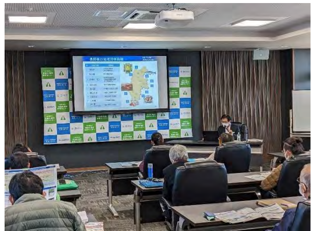
12/20 知的財産権入門セミナー