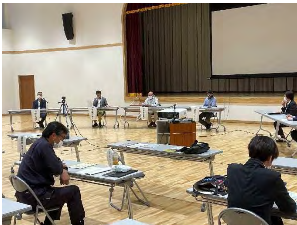
10/6 地域資源活用シンポジウム