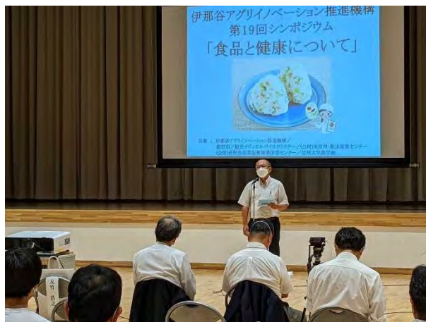
伊那谷アグリノベーション推進機構 R4. 7. 31 第19回シンポジウム