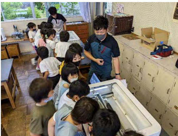
飯田市内の小学校での 出張デジタルものづくり体験講座