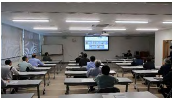
航空機電動化・次世代エアモビリティ事業 R4. 12. 19 第1回航空機用モータ勉強会