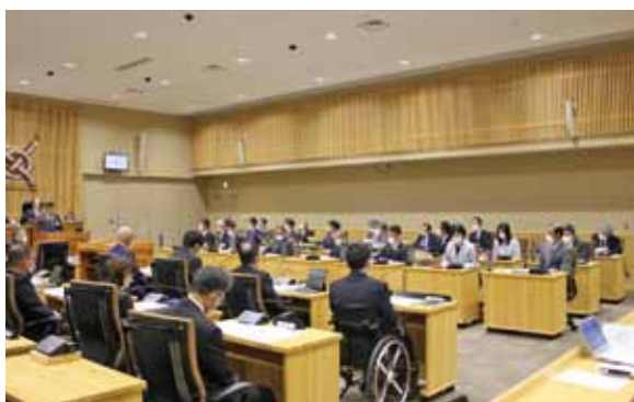
▲臨時会の議場の様子