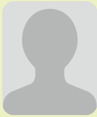
氏名 主な役職 常任委員会 期数 出身地区 所属党派