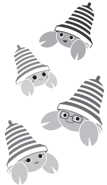
ベルマークファミリー