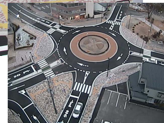
東和町交差点(ツノアハウ)