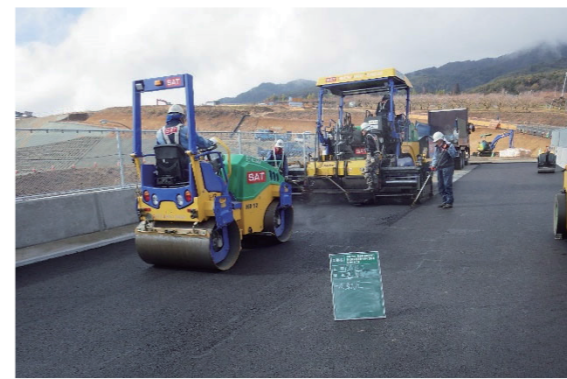
ほそうこう 舗装工 車道をアスファルトで舗装します