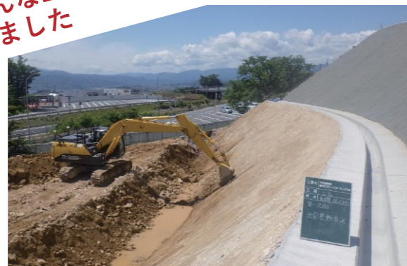
どこう 土工 土を削ったり盛ったりします