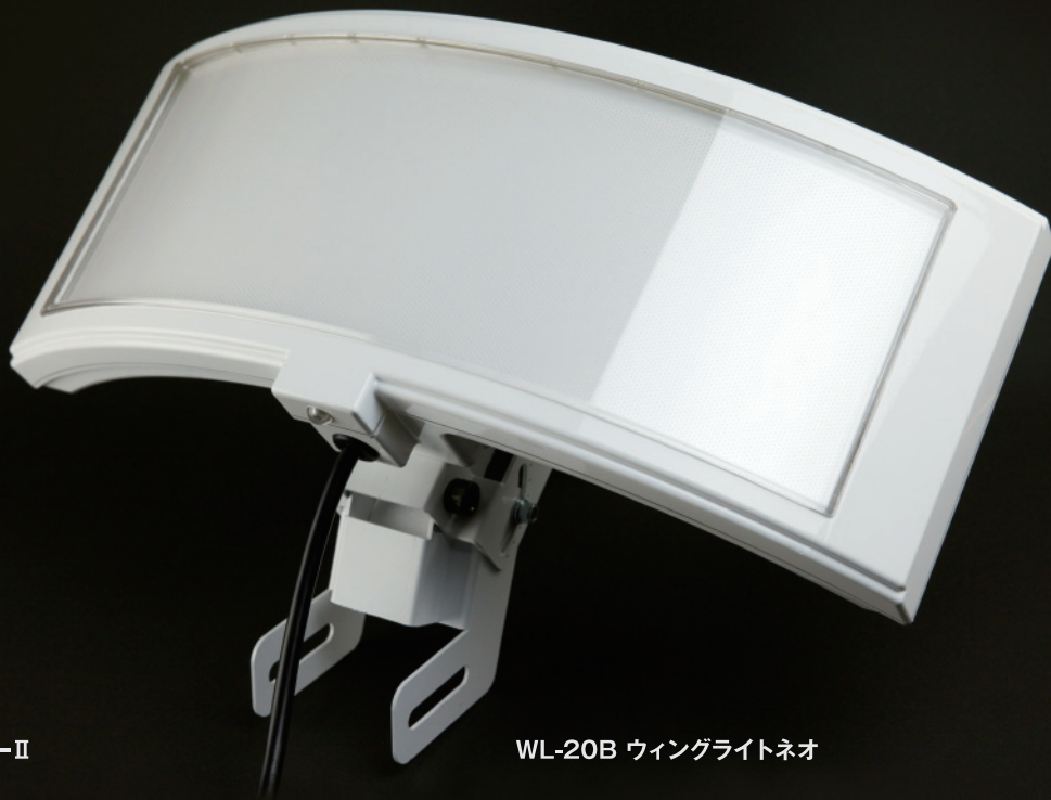
WL-20B ウィングライトネオ