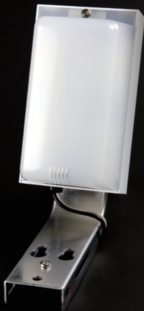
AL02-1 サイドビューアーII