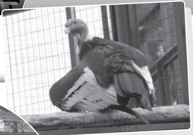
広い飼育舎で戸惑いを見せるアンデスコンドル

8月から工事を行っていたアンデスコンドル獣舎が10月27日にリニューアルオープンしました。