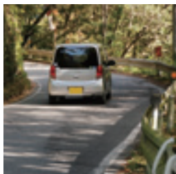
軽自動車でもすれ違いが困難な場所が多い(南信濃地区)

現道活用区間は、経済的な理由もあり、既存の一般道路を活用しながら整備する区間です。 長野県側について、上村地区内は、平成23年の豆嵐トンネル開通を最後に整備が完了しています。 現在、南信濃地区側で整備が進められています。