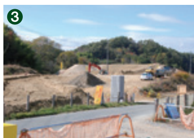
飯田東IC(仮)予定地付近