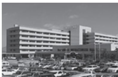
飯田市立病院 〒395-8502 飯田市八幡町438 TEL.0265-21-1255

RSウイルスに感染した際は残念ながら特効薬はありません。多くの場合は対症療法が中心で、水分補給、栄養、睡眠、保温、加湿などに心がけ安静にして経過をみることにあります。咳がひどく、ゼーゼーして呼吸困難が強い、高熱でぐったりして水分が摂れないなどの症状がある場合は入院が必要になることがありますので、医療機関を早めにご相談ください。