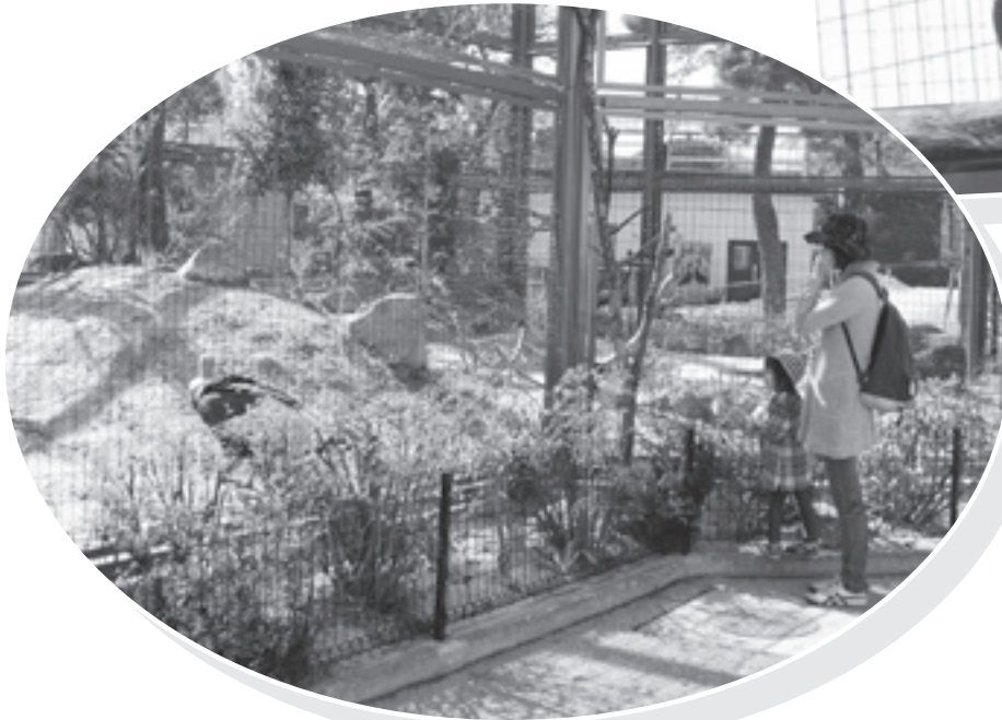
岩穴や起伏のある地面で生息域を再現

コンドルの愛称は、「ドルチェ・アイアン」で30歳のオスです。飯田に来て29年になります。