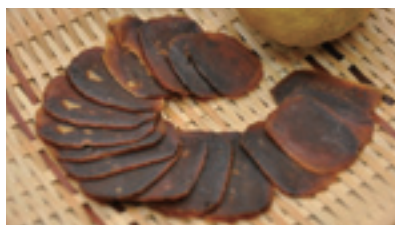
餅子：柚子の中身をかき出して、中に味噌やクルミを詰めて蒸して乾燥させたもの。伝統の保存食。酒のつまみやご飯のおかずになる。

客さんが後日ここに訪ねて来られる事があり、今でも交流が続いている方がたくさんあります。紅葉の時期には、特に多く訪ねて来てくれます。五平餅やそばを食べたりして、とてもにぎやかになります。