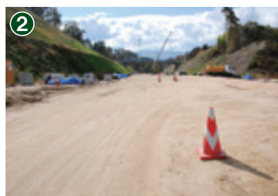
龍江IC(仮)予定地付近