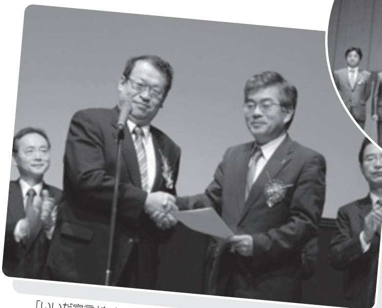
「いいだ宣言」を内閣府定住外国人施策推進室長へ手渡す