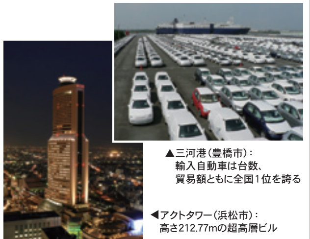
▲三河港(豊橋市): 輸入自動車は台数、貿易額ともに全国1位を誇る ◀アクトタワー(浜松市): 高さ212.77mの超高層ビル