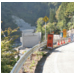
整備中の小道木バイパス(南信濃地区)