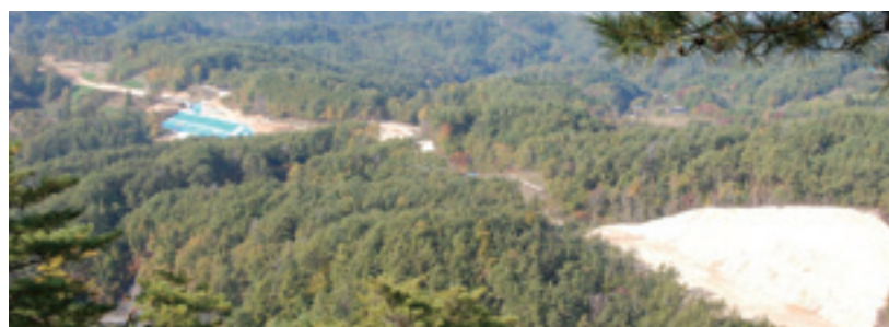
神之峰(上久堅)から飯喬道路を望む