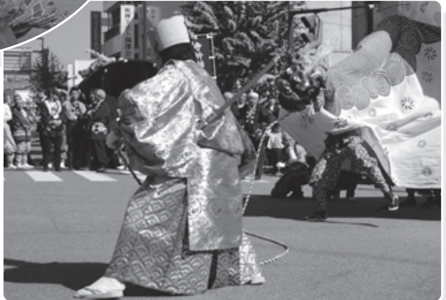
鼎一色獅子舞保存会

中央公園では、郷土料理や伝統食が集まる「南信州うまいもん大集合!!」も同時開催されました。