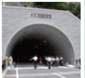
豆嵐(まめざれ)トンネル(上村地区)