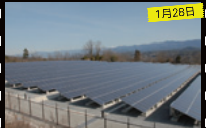
メガソーラーいいだ