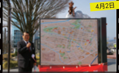
飯田駅前観光案内表示除幕式