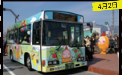
ラッピングバス出発式