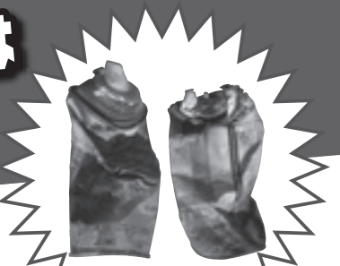
誤って埋立ごみとして出され、火災の原因となったスプレー缶

今年に入って、埋立ごみに混ざっていたスプレー缶類を原因とするごみ収集車両の火災が発生しました! 正しく処理しましょう!