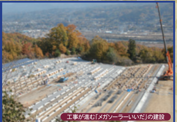
工事が進む「メガソーラーいいだ」の建設

2月24日、飯田市と中部電力㈱でメガソーラー発電所を共同で建設することについて協定を締結しました。平坦で日照時間が長く、市民の目に触れやすい場所として市が所有する川路の城山地籍に建設が進められています。敷地の一角には太陽光発電のPR施設も建設します。