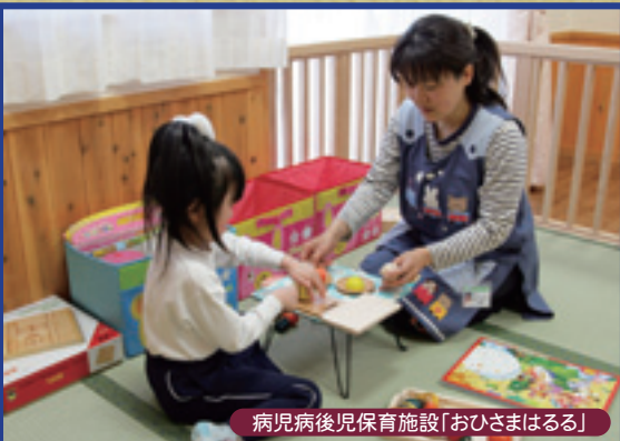
病児病後児保育施設「おひさまはるる」

飯田市では子育てで支援に関する取り組みを計画的に進めるための「新すくすくプラン」の前期計画を見直し、3月に後期計画を策定しました。また4月に健和会病院内に病児病後児保育施設を開設し、更には10月の南信州定住自立圏形成の追加協定により、圏域内の町村の子どもも利用可能となりました。