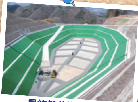
最終処分場の完成

4月4日、遠山中学校の開校式が、新入生12人と上村中学校からの転入生8人を含む全校生徒35人で行われました。校章を一新し、校歌の一部も改訂して、新たな気持ちで出発しました。