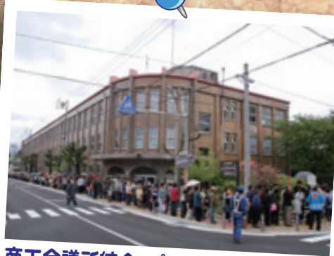
商工会議所統合・プレミアム商品券発売

飯田商工会議所、鼎商工会、上郷商工会、遠山郷商工会が統合し、新しい飯田商工会議所が誕生したことを記念して、4月26日にプレミアム商品券を発売しました。合計1万部の商品券が、市内15箇所の販売所で用意されましたが、販売所前には長蛇の列ができ、2時間で完売となりました。