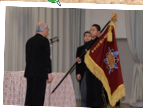
上村中学校の閉校、遠山中学校の開校

3月17日、遠山中学校との統合による上村中学校の閉校式があり、参加した保護者や卒業生などが校歌を斉唱して、62年の歴史に幕を下ろしました。