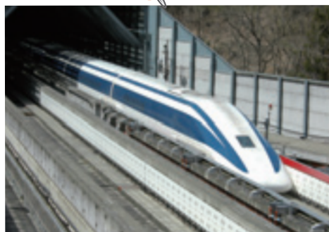
リニア推進対策室の組織体制を強化

プロから直接指導を受けられる「音楽クリニック」や、迫力ある「名曲コンサート」など、プロオーケストラが市民にぐっと近づき、新たな感動が生まれた4日間でした。