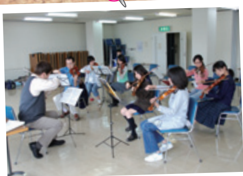
オーケストラと友に音楽祭

3月29日には、千代に新しく建設した最終処分場（グリーンバレー千代）の竣工式を行いました。