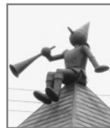
時の番人 (ハミングバル)