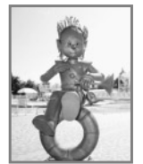
水の番人 (アクアパーク)