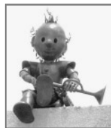
出会いの番人 (アイパーク)

応募・問い合わせ 〒395-8501 飯田市大久保町2534 飯田市役所 商業・市街地活性課 内線4650 FAX 0265(52)1719 Eメール shigaichi@city.iida.nagano.jp