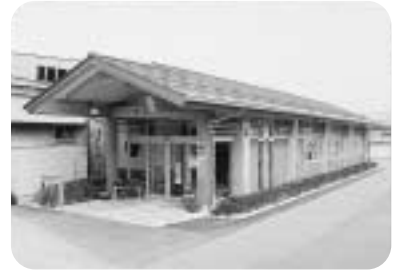
新しくなった玄関

天然温泉を利用した運動用プールでは、水中運動教室が行われています。また、露天風呂も備えた一般浴槽もありますので、癒しの場や健康づくりの場として、ぜひご利用ください。