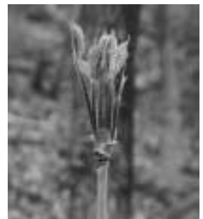
コシアブラの新芽

植物や森林に興味をお持ちの方は、お気軽にいろいろと教えてください。また、ご質問もお受けしています。