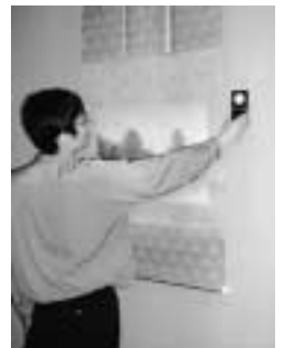
光の量を調整中。お持ちの美術品の展示環境などでお悩みの方は美博までご一報を。

美術品を取り巻く環境を整えるのも、私たち学芸員の仕事です。おかげで私は日に焼ける機会にも恵まれず、徐々に色白になっていきます。これが美博効果というものなのでしょう。