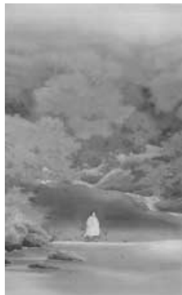
菱田春草筆「菊慈童」 (縦181.1cm×横110.7cm)

10月20日(土)～11月11日(日)の間、飯田市制施行70周年記念特別展「絵画のなかの物語」において、飯田市美術博物館で展示します。