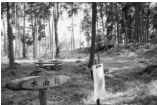
南本城城跡「本曲輪」

座光寺地区では「麻績の里振興委員会」を組織し、遊歩道整備など環境整備に取り組んでいます。また、座光寺地区財産区が主体となり、間伐や植栽、東屋の建て替えをするなど、地域をあげての保存・学習・愛護活動が行われています。