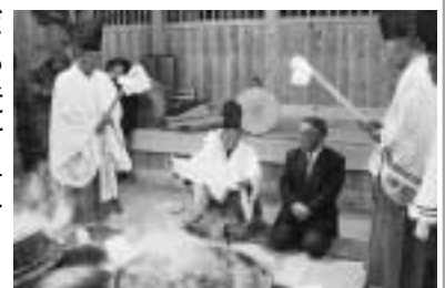
遠山の霜月祭(中郷)の神子上げ人が「神の子」となる儀式