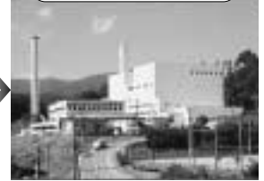
桐林クリーンセンター

当日上記の時間に、直接施設にお越し ただいても見学ができます。資料を用意 しますので、事前にご連絡ください。