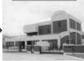
竜丘浄化センター