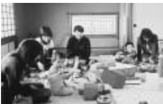
松尾つどいの広場