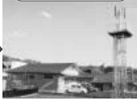
飯田広域消防籠江分署