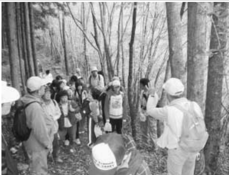
環境チェッカー秋の里山観察会風景