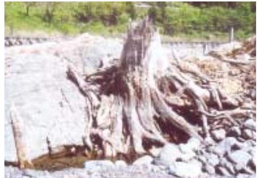
遠山川河床に現れた埋没ヒノキ

今回の展示では、埋没林がもつ不思議な世界を紹介するとともに、遠山を襲った地震とそれに伴う山くずれおよび天然ダム形成という一連の「遠山大地変」を科学的に解説し、山国の大地の営みを考えます。