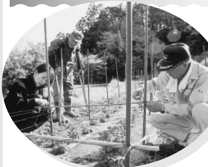
父娘が協力しての作業