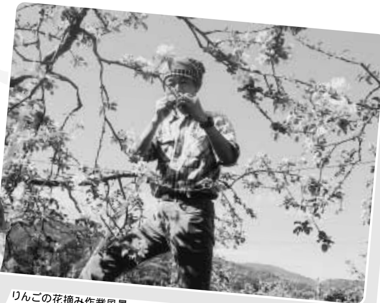
りんごの花摘み作業風景

4月29日～5月2日、5月3日～6日と、2回に分けて実施しました。リピーター25人を含む118人の方々が、忙しい農家の助っ人として3泊4日の仕事に就きました。