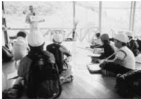
アドバイザーによる学習会風景

市民の皆さんに、環境に関する理解を深め、意識をさらに高めていただくために、環境の保全や創造について専門的な知識・技術をお持ちの方を登録し、環境学習会などの場に講師や指導者として紹介する制度です。