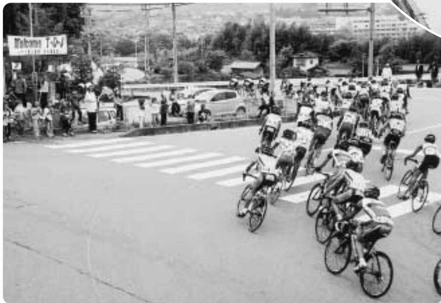
沿道からの声援が響く

5月17日、第10回ツアー・オブ・ジャパン南信州ステージが開催され、選手たちは、厳しいアップダウンで評価が高い山岳コースの12周に、全力で挑んでいました。目の前を猛スピードで自転車が通過するたびに、沿道にあふれる驚嘆と感動の歓声。幼児からお年寄りまで大勢の皆さんが、小旗を振って熱心に選手を応援し、レース観戦を心から楽しんだ1日でした。