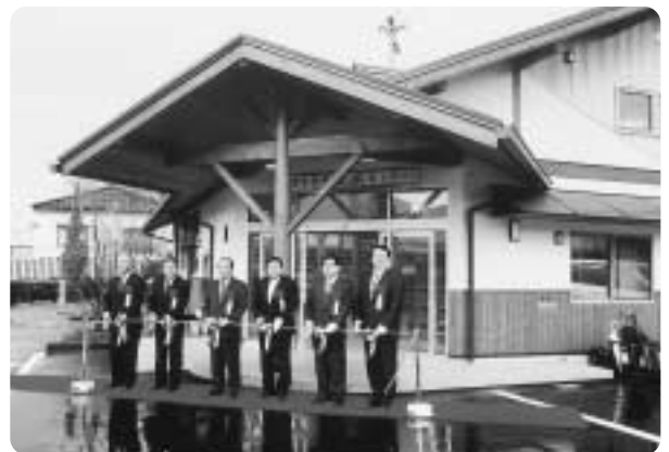
伊賀良公民館駐車場敷地内に開館

4月20日、伊賀良学習交流センターしゅん工式を行いました。これは、図書館伊賀良分館を移転したもので、図書館として、また、郷土について学び、交流する場所として、多くの皆さんの期待が込められた施設です。