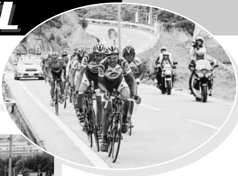
急坂を全力で駆け抜ける

5月17日、第10回ツアー・オブ・ジャパン南信州ステージが開催され、選手たちは、厳しいアップダウンで評価が高い山岳コースの12周に、全力で挑んでいました。目の前を猛スピードで自転車が通過するたびに、沿道にあふれる驚嘆と感動の歓声。幼児からお年寄りまで大勢の皆さんが、小旗を振って熱心に選手を応援し、レース観戦を心から楽しんだ1日でした。