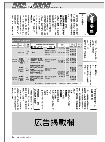
1号につき4枠、黒1色刷り

政治・選挙・宗教・風俗・貸金業に関連する広告 事実と反する表記を含む広告、内容が誇大である広告 など