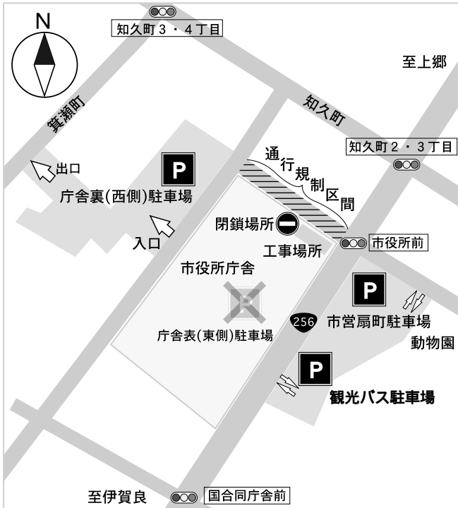
市役所駐車場案内図