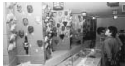
遠山郷土館「和田城」の見学

9:00…県文化センター出発 10:10～10:40…木工センター「とちの木」 11:10～11:45…下栗の里(高原ロッジ下栗周辺) 12:15～13:00…レストラン「味ゆ～楽」(昼食) 13:10～14:10…遠山郷土館「和田城」 14:15～15:15…遠山温泉郷「かぐらの湯」 16:45頃…県文化センター到着・解散 雨天の場合、コースを変更することがあります。