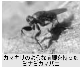
カマキリのような前脚を持った ミナミカマバエ

わずか数ミリの虫に心が震えるような感動を味わえる幸せを、人に伝えるのはなかなか難しいことです。けれど、学芸員の仕事はそれを伝えることだと思っています。 多くの方に、自然の不思議と出会うことの楽しさを知っていただきたいと思っています。興味をお持ちになった方、ぜひ、美術博物館にお出かけください。