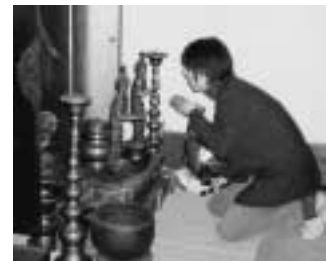
仏像調査のーコマ

まだ美博とご縁のないお寺のご住職さんや総代さん、無住のお堂を管理されている地区の皆さん、什物じゅうもつ調査の必要があれば美博にひと声お掛けください。