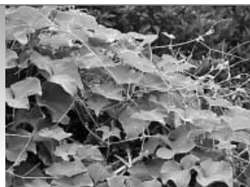
河川敷などに広がるアレチウリ