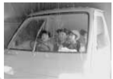
降雨体験車「あめ太郎」での降雨中の ドライブ体験