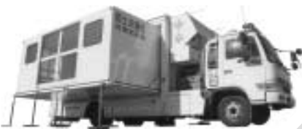
災害時に活躍する 対策本部車

8月は「道路ふれあい月間」、8月10日は「道の日」、そして8月25日(木)～31日(水)は「道路防災週間」と、8月は道路に関するさまざまな取り組みが行われます。市内では、下記のイベントが行われます。日々の暮らしにおいても、災害などの非常時にも、重要な役割を持つ「道」のこと。この機会に体験し、一緒に考えてみましょう。