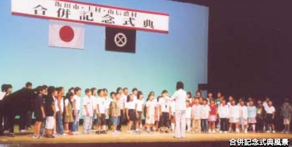
合併記念式典風景