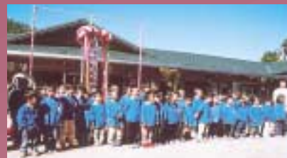
式典後、園児の歌声が響く

11月1日、社会福祉法人千代しゃくなげの会が設立され、千代保育園の経営を移管しました。市民による福祉活動の新しい取り組みに期待が寄せられています。