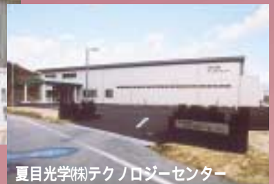
夏目光学(株)テクノロジーセンター