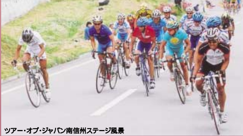
ツアー・オブ・ジャパン南信州ステージ風景