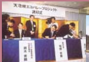
パートナーシップ宣言風景

探り、また、多くの人々の視点を通じて飯田市の資源を見直し、活用する取り組みを進めます。