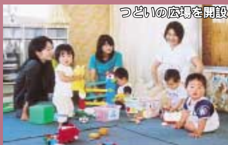
つどいの広場を開設

また、児童虐待ゼロのまちを目指し、「子育て支援ネットワーク協議会」を立ち上げました。