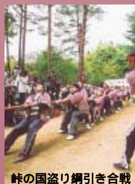
峠の国盗り綱引き合戦