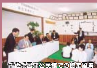
千代毛呂窪公民館での協定風景

6月9日、地元千代の皆様のご理解を得て、処分場の建設同意と環境保全についての協定を締結。施設は平成18年度に着工し、21年度に供用を開始する予定です。