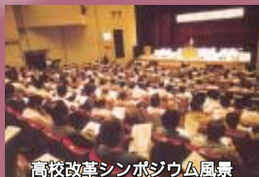
高校改革シンポジウム風景

長野県が示す高校再編案に端を発した「高校改革問題」。地域の将来にも関わる重要課題の1つとして位置づけ、7月11日には、県公民館で「高校改革シンポジウム」を開催。南信州広域連合では、「未来検討委員会」を設置するなど、検討を行ってきました。