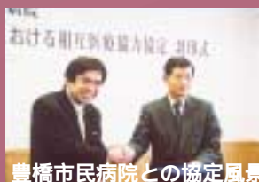
豊橋市民病院との協定風景