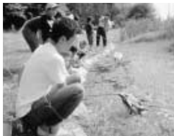
なにがとれるかな？

6月26日(土) 10:00から 場所：食の工房・木の工房 東海地震等大災害に備えて子どもたちの災害に対する意識を育てます。 子どもが自分たちでロウソクを作ります。 自分で卓上コンロを作ります。 それを使ってご飯や料理を作ります。 事前に事務局に申込をしてください。 主催 飯田ボランティア協会