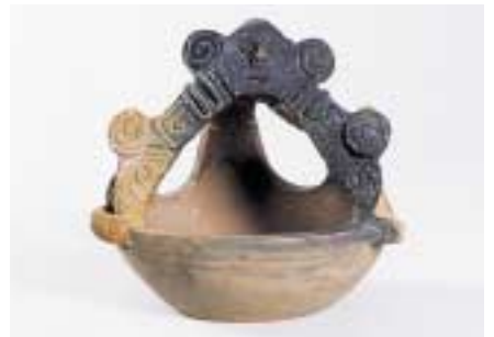
黒田垣外遺跡の人面付釣手土器