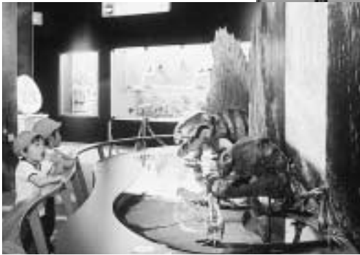
古生代展示室のディメトロドン

7月16日～9月12日は特別企画展「恐竜後の世界 よみがえる新生代の生きものたち」を開催します。他にも、「ダイナビジョンシアター」(大型映像)や、「収蔵資料紹介展」、「展示解説会」、「自然史講座」、「学習教室」など多くの催しを予定しています。 豊橋市自然史博物館は、動物園、植物園、遊園地を併設した豊橋総合動植物公園内にあり、小さな子どもから大人まで一日楽しく過ごすことができます。皆さんぜひお出かけください。