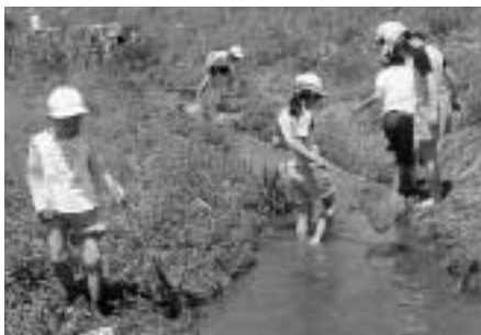
河原の貝を探しましょう

昭和36年6月23日から降り始めた雨は、26日には集中豪雨に変わり、翌27日には1日にして6月の平均雨量を越える雨が降り注ぎました。 日本の土砂災害史上でも未曾有の大災害となった「三六災害」。忘れてはいけない天竜の歴史を紹介します。