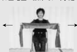
これが「ずくバンド」です