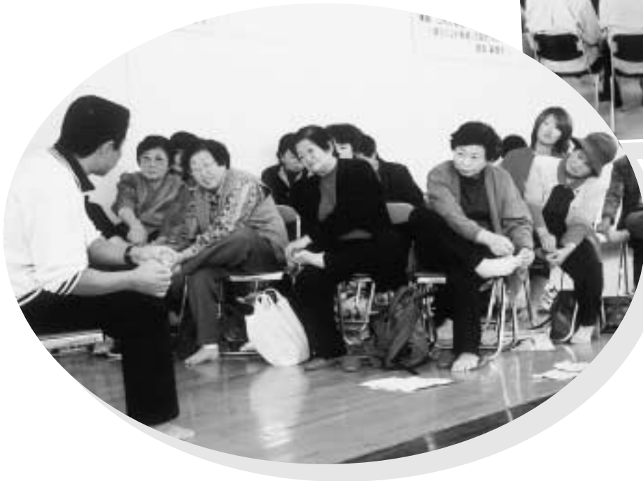
足の裏測定の風景

生活、健康、環境に関係した催しやさまざまな展示、体験コーナーのほか、バザーやフリーマーケットなどもあり、大勢の皆さんでにぎわいました。体力測定をしたり、自然エネルギーを感じたりして、普段忙しく暮らす毎日を少し振り返ってみることができました。