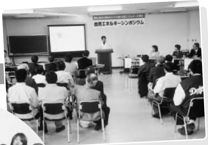
自然エネルギーを考える

11月6日・7日、「できることから始めよう!健康と環境を考えて」をテーマに、県体育館、県公民館、県文化センターで行いました。