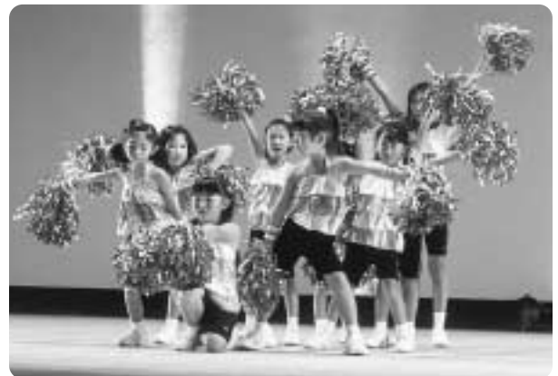
たかぎ いちごキッズ

11月7日・14日・21日・23日の4日間、文化会館と人形劇場で開催しました。飯田・下伊那で活動しているアマチュアの皆さん約2,000人が参加し、1年間の練習の成果を発表しました。