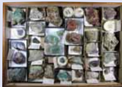
收藏・整理された標本箱