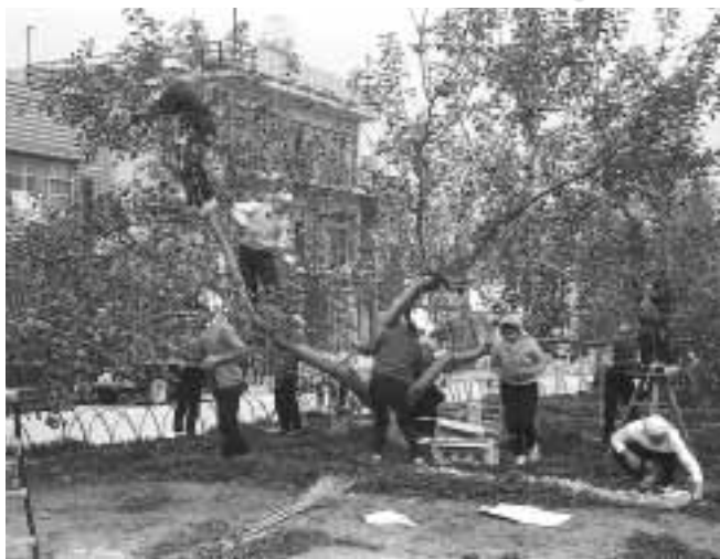
S40年 りんご収穫作業風景