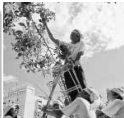
H15年 りんご収穫作業風景