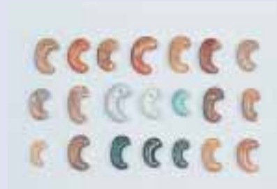
さまざまな石で作られた勾玉 (松本市 南方古墳)