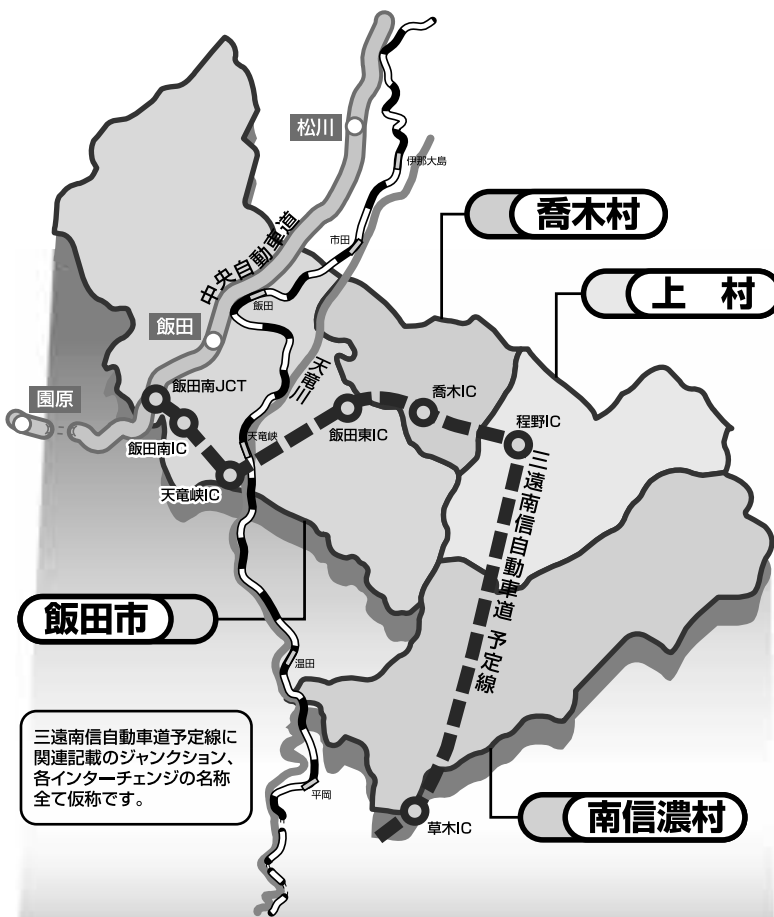
三遠南信自動車道予定線に 関連記載のジャンクション、 各インターチェンジの名称 全て仮称です。

賛同をいただいたと判断し、 任意合併協議会を設立し ました。 多くの方からご意見を いただきましたが、今回 その内容をお伝えします。