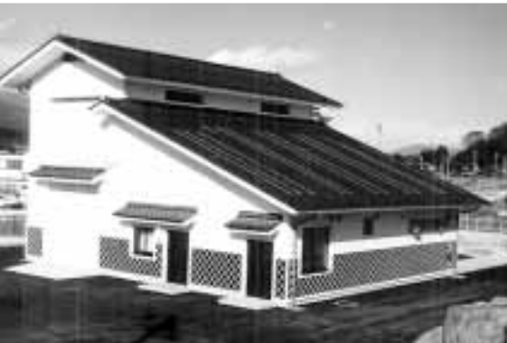
農集排 更生太田地区 処理場4月供用開始

まだ水洗化されていない方は、この融資あっせん制度を利用いただき、早急に水洗化されるようお願いいたします。