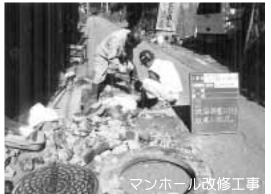
マンホール改修工事