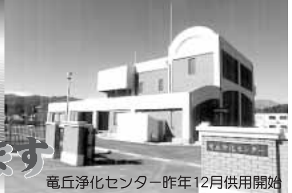
竜丘浄化センター-昨年12月供用開始