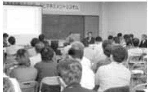
先進事例を聞き議論する分科会（昨年の様子）

■ 問合せ いいだ会議実行委員会 環境保全課内 ☎(22)4511 内線5246