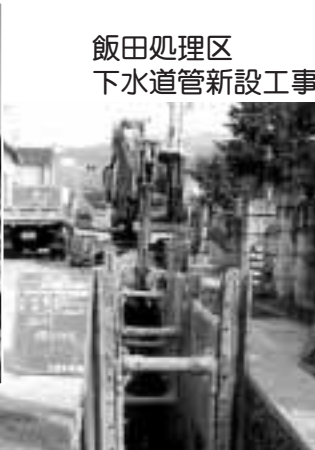
飯田処理区 下水道管新設工事