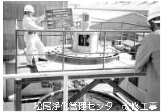
松尾浄化管理センター改修工事