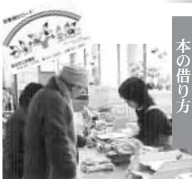
(貸し出し方法には、変更はありません)

皆さんに親しまれる図書館を目指し、来年度は、開館時間を延長し、利用サービスを改善します。また、平成15年の貸出ベスト5が決まりましたのでお知らせします。さらに使いやすいなる図書館を、ぜひご利用ください。