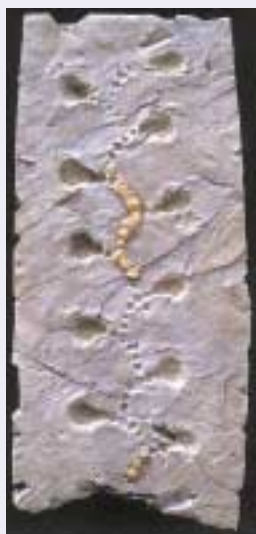
ジュラ紀の怪物、タツツェブルム (無脊椎動物が掘ったトンネルの跡)