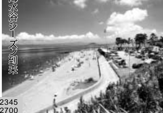
三市合同企画第十五回

遠浅で波の穏やかな三河湾には、キャンプ場が併設されたり、夏季のみ船で渡ることができると多くの海水浴場があります。ぜひ遊びにいらしてください。