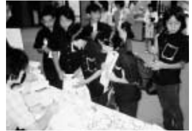
予選会受付風景(他市会場)

「BSジュニアのど自慢」は、中学生以下が参加する「のど自慢」番組です。出場および観覧ご希望の方は、下記の要領にしたがってお申し込み下さい。