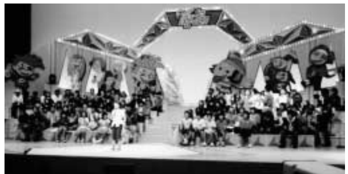
本番リハーサル風景(他市会場)