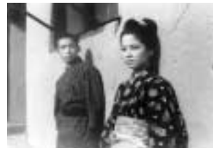
『野菊の如き君なりき』