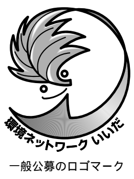
一般公募のロゴマーク

飯田下伊那には環境問題に取り組んでいる市民団体がたくさんあります。それぞれの団体は、環境保全のため欠かせない取り組みをしています。団体間の連