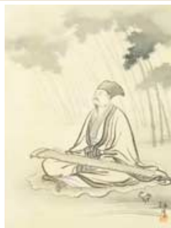
西郷孤月筆「王維字摩詰」明治38年(1905) <岩崎新太郎コレクション>