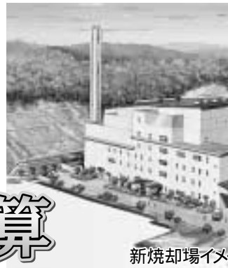
新焼却場イメージ