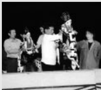
今田人形の館での練習

回以上を超える公演を行っています。保存会の再発足で四百名の会員を始め、市民の方々の支えが、人形座の更なる発展の励みとなっています。