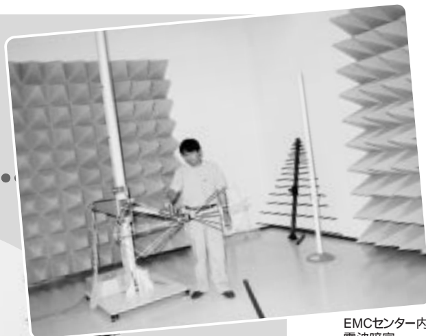
EMCセンター内 電波暗室

景気が低迷している中、工業課を新設。製造業をはじめとする市内企業の支援、エコタウン事業のより一層の推進、5月から本格運用のEMCセンターの活用など、産業振興により力を入れていきます。