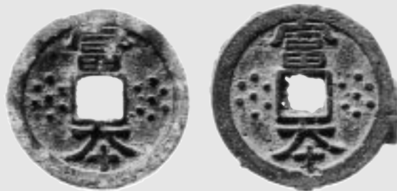
座光寺で発見された富本銭(左)と飛鳥池から出土したもの

高森町に続き、富本銭が飯田からも発見。当時、馬の生産地として、古くから栄えたこの地方と中央政権の交流がまた一つ立証されました。