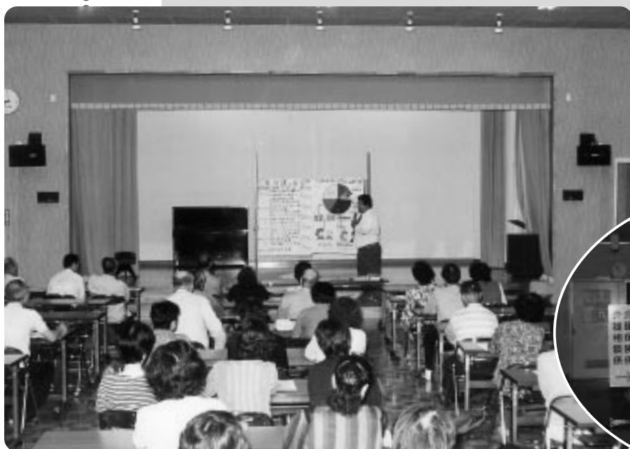
座光寺公民館での説明会

来年4月から実施される介護保険。その制度をご理解していただくため、地区説明会を5月から始めています。関心も高く、会場では熱心に聞き入る人ばかり。この7月からは、介護保険課を新設しました。