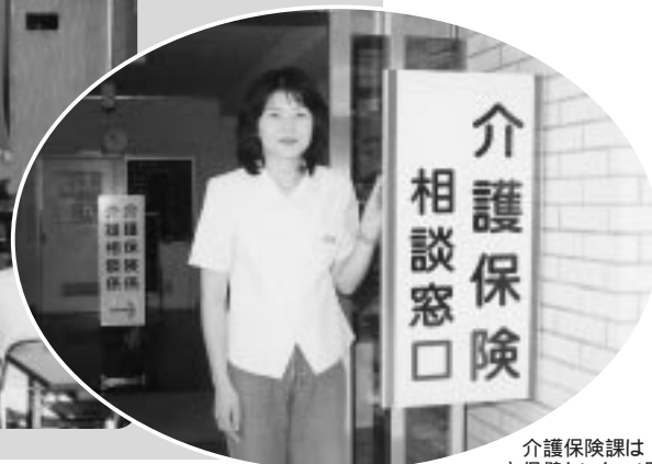
介護保険課は 市保健センター1階に