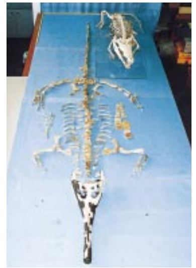
復元されたエンシュウワニ(体長約3.6m) 右奥は現生イリワニ

開館時間：午前9時半~午後5時(入館は4時半まで) 観覧料：一般310(210)円 高校生200(150)円 小中学生100(80)円 ( )内20人以上の団体 休館日：7月5日、12日、19日、21日、26日、8月2日、9日