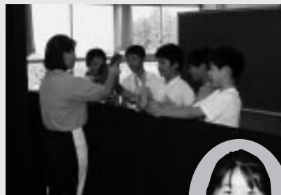
8月6日 午後2時から上演 浜井場小学校人形劇クラブ 6年生7人、5年生4人で構成