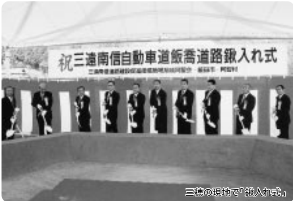
三穂の現地で「鍬入れ式」

中央道の山本と静岡県三ヶ日町の東名高速を結ぶ延長約100kmの三遠南信自動車道。その起点となる、山本～天竜峡間が、いよいよ着工に。南信地域の大きな夢が確かな一歩を踏み出しました。