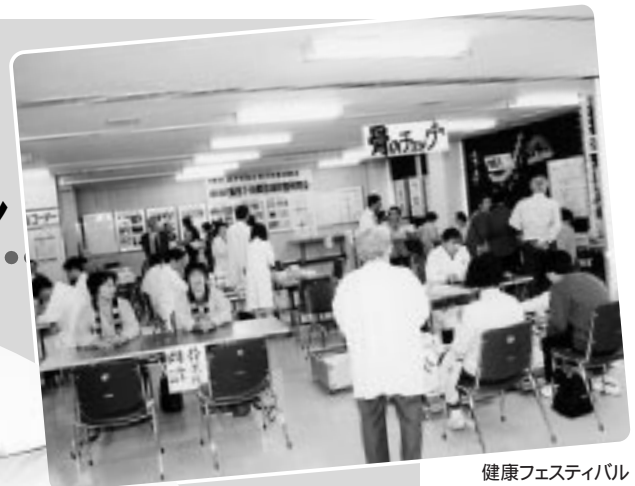
健康フェスティバル

11月14日、市民館、中央公園、りんご並木一帯は多くの人でごったがえしました。26回を迎えた農業祭、市内を始め、県内外の農作物の展示、即売が大盛況。健康フェスでも多くの人出があり、昨今の関心の高さを示していました。