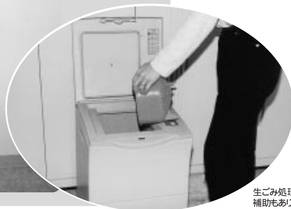
生ごみ処理機へ補助もあります。