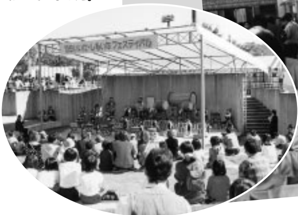
同日、運動公園で行われた飯田下伊那フェスティバル

10月23・24日の両日、地場産業センターで開催。地場産業センター開館15周年記念の地場産祭りも行われました。リサイクルなど環境に対する関心も高く、大勢の来場者で賑わっていました。