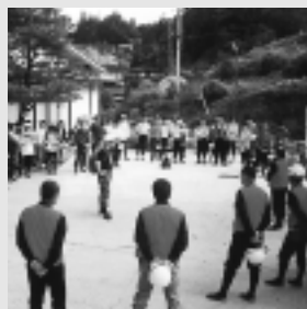
体験修学旅行のインストラクターとしても活躍

発足して十八年、会員は固定して現在十六名。相変わらずチャレンジ精神が旺盛で、楽しく活動しています。月一回の定例会が開かれませんが、まず活動費稼ぎの「門松」や婦人の技能を活かした「盆ゴザ」の制作販売。交流事業では、中央通り一丁目での夏の人形劇フェスタ歩行者天国「法山邑」、年末ジャンボ門松の設置など。また、天下の秘境万古溪谷