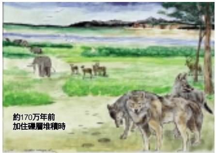
約170万年前 加住礫層堆積時