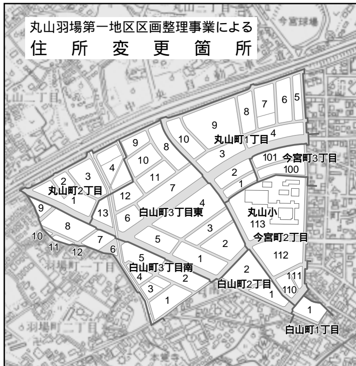
丸山羽場第一地区区画整理事業による 住所変更箇所

白山町3丁目東の全部 丸山町1丁目、同2丁目、 白山町1丁目、同2丁目、 同3丁目南、今宮町2丁 目、同3丁目の各一部 問合せ 区画整理について