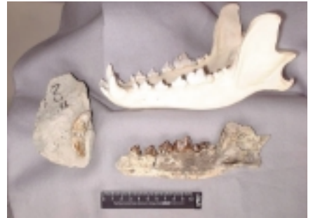
上:カナダ産現生タイリクオオカミのしたあご 下:発見されたイヌ属のしたあご

斜線部: 肩甲骨は右、橈骨は左右不明。 Peles & Garcia(1981)に加筆 色つき部分が見つかった骨の部分