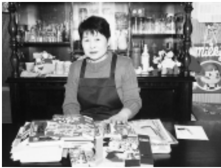
ごみ減量のため、菓子の空き箱は、たたんでリサイクルへ

私は現在、上郷地区環境衛生組合の婦人部長として活動しています。飯田市に合併した当時は、環境やごみ問題は大きく取り上げられていませんでしたが、最近はごみなどに対する関心が高くなっています。日頃の活動のなかで、貴重な体験をさせていただきまし、また現場へ立つ者とし