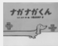
ナガナガくん シド・ホフ作