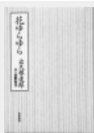
花ゆらゆら 久根達郎 / 著

著者は「母を畏れ敬う気持ちには本への感情とよく似ている、どちらも私を育て、自信と謙虚さを教えてくれた」と語った。この本には、強く優しい著者の母親、書店を経営し、本に愛情を注いだ母親の姿が綴られている。(M)