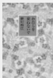
私を束ねないで 新川和江 / 著

自分はいったい何なのだ。妻なのか母なのか、女なのか。周期的にやってくる迷いの時期にてのひらほどのこの詩集を手にする。ページの中から語りかけてくる一つ一つの詩が、失いかけていた妻、母、女、一個の人間としての自信を取り戻させてくれる。(K)