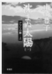
沈まぬ太陽(全5巻) 山崎豊子 / 著

自分はいったい何なのだ。妻なのか母なのか、女なのか。周期的にやってくる迷いの時期にてのひらほどのこの詩集を手にする。ページの中から語りかけてくる一つ一つの詩が、失いかけていた妻、母、女、一個の人間としての自信を取り戻させてくれる。(K)