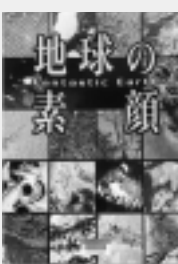
地球の素顔 小学館

巨大航空会社の元組合委員長だった主人公は、会社の不都合に敢然と抵抗した。非情な組織は、彼を海外の過酷な地へ追いやるが、ぼろぼろになりながらも、決して屈せず信念を貫き通す。生きることに意味を問いかける大作。(F)