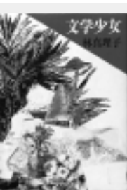
文学少女 林真理子 / 著

この本には36×51cmの地球の素顔が40枚収められている。地球の素顔。それは、高度七百公里上空に浮かぶ、地球観測衛星ランドサットからの写真。自然の色の美しさ、造形の不思議さと人造物の妙技を、宇宙に行った気分を楽しめる。(Y)