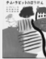
チム・ラビットのぼうけん A・アトリー作

字がおおきくて、あついはんでおもしろいほんさがしとの。このまえこの本がおもしろかったもんで。