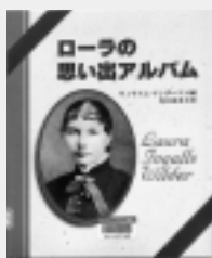
ローラの思い出アルバム ウィリアム・アンダーソン / 編

五十話すべてが花にまつわるエッセイ集。「花を思い出すと、必ずそこに昔の私の姿がある」とあどがきにもあるように、人の生活と花とは、案外関わり深いのかも知れない。この人のエッセイはいつ読んでも心が穏やかになる。(E)