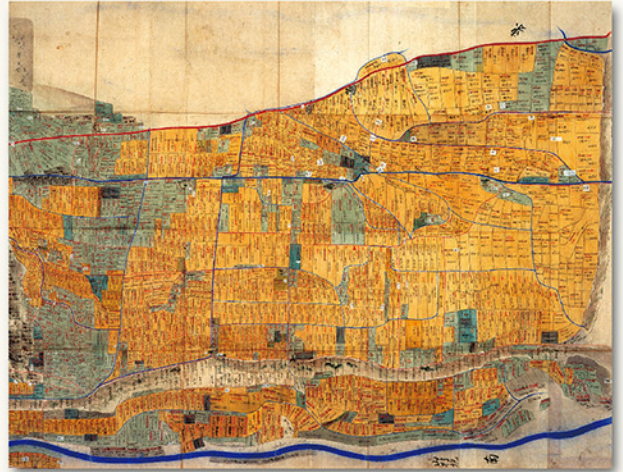
信濃国伊那郡上飯田村田畑山林地引絵図 沓 (現在の羽場地区) 黄色は田地、緑色は畑地、青色の線は河川や水路、赤色の線は道を表しています。上部の赤色の線は大平街道、下部の太い青色の線は松川です。

今回、この上飯田村の地引絵図を、『絵図でみる上飯田の今昔—明治初めの地引絵図—(仮)』として刊行します。本書では上飯田村の地引絵図を読みやすい大きさに分割して丁寧な解説を加えるとともに、地図や写真によって現在の上飯田地区の様子とも比較できるようになっています。既刊の『飯田・上飯田の歴史』上下巻とも関連しているので、合わせて読むことで、より深く地域の歴史を知ることができます。みなさんも本書を片手に上飯田の歴史を訪ねてみはいかがでしょうか。