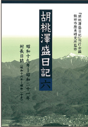
最新刊 第6巻 (2013年12月刊行)

昨年12月、『胡桃澤盛日記』の掉尾となる第6巻を刊行しました。2010年より始まった「胡桃澤盛日記」の刊行事業ですが、この間さまざまなかたちで御協力をいただきました多くの方々、および御賛助を賜りました皆様に、お礼を申し上げます。