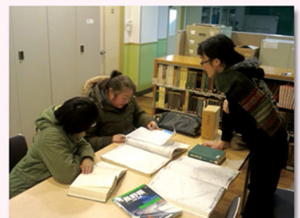
ワークショップ活動の様子