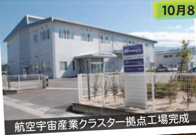
航空宇宙産業クラスター拠点工場完成