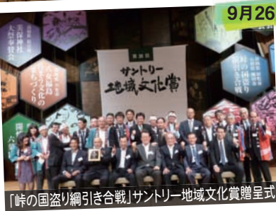
「峠の国盗り綱引き合戦」サントリー地域文化賞贈呈式