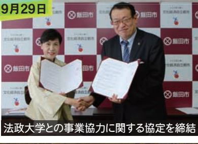
法政大学との事業協力に関する協定を締結