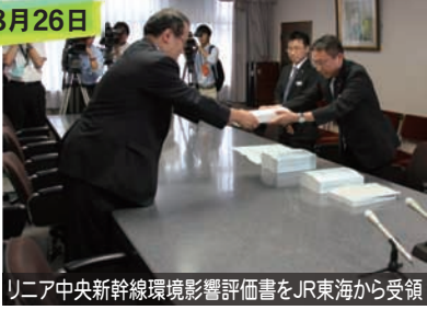
リニア中央新幹線環境影響評価書をJR東海から受領