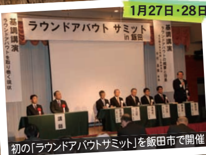
初の「ラウンドアバウトサミット」を飯田市で開催