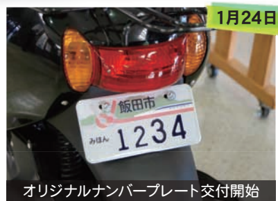
オリジナルナンバープレート交付開始