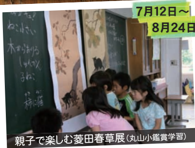
親子で楽しむ菱田春草展(丸山小鑑賞学習)