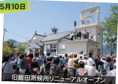
旧飯田測候所リニューアルオープン