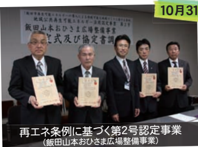
再エネ条例に基づく第2号認定事業 (飯田山本おひさま広場整備事業)