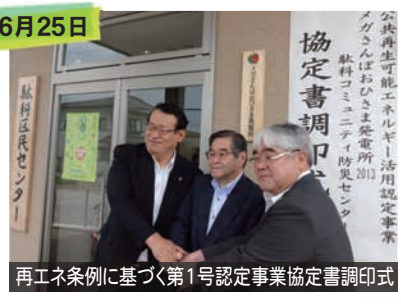
再エネ条例に基づく第1号認定事業協定書調印式