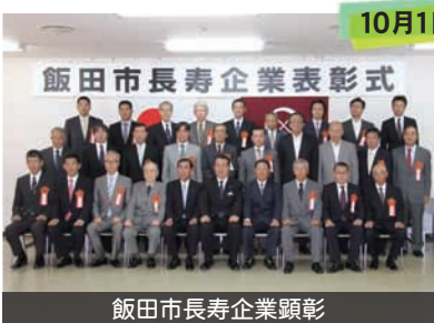
飯田市長寿企業顕彰