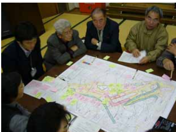
グループごと話し合いました