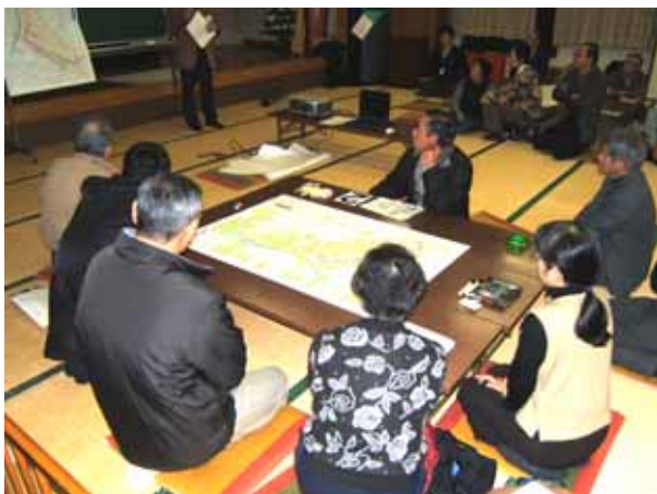
事務局より説明を行いました

その後、2つのグループに分かれてワークショップを行い、第2回懇談会で作成した「将来こうあって欲しい」地図を参考にしながら、課題の解決方法などについて話し合いました。グループ発表後、出された意見を宅地・農地・森林などに分類して表に整理しました。(出された主な意見は裏面のとおりです)