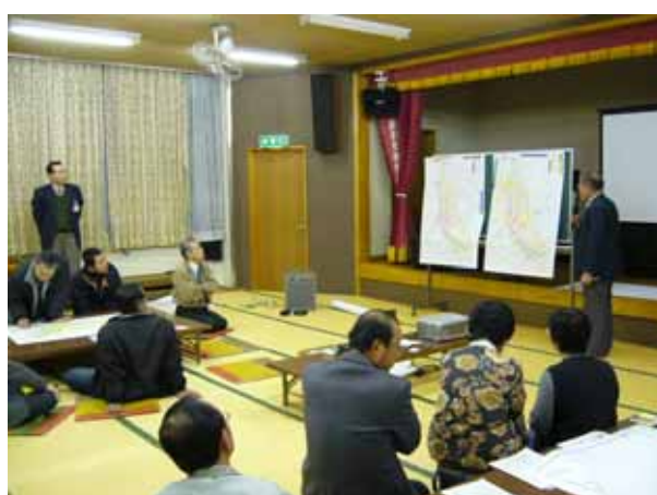
話し合われた内容をグループごと発表しました