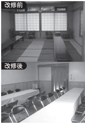
待合室は畳からイス席に