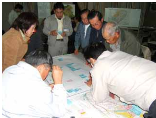
発表後、意見を表に整理しました