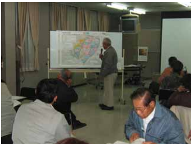
話し合われた内容をグループごと発表しました