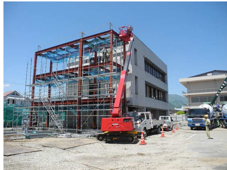
5月 保健センター増築部鉄骨工事