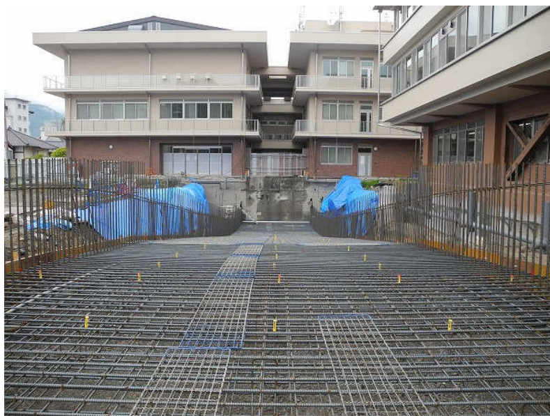
5月 地下進入スロープ築造工事