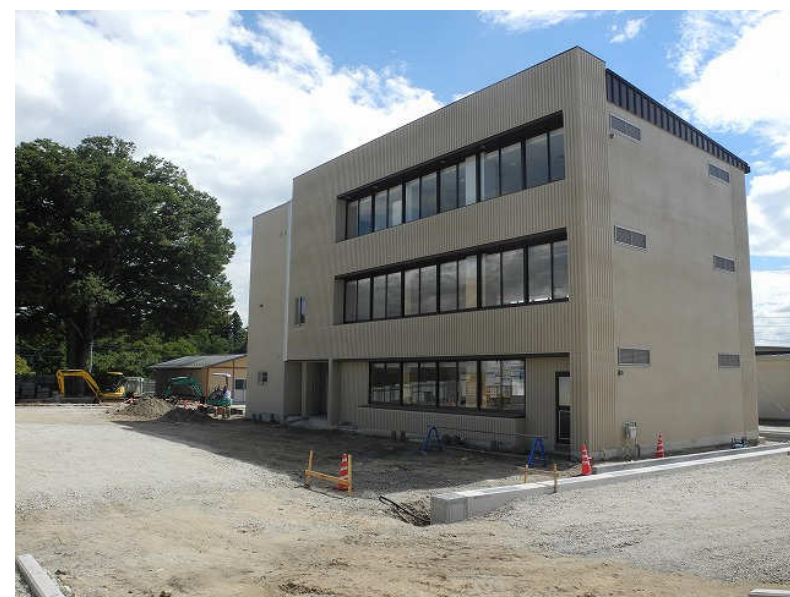
8月 保健センター外装・内装工事