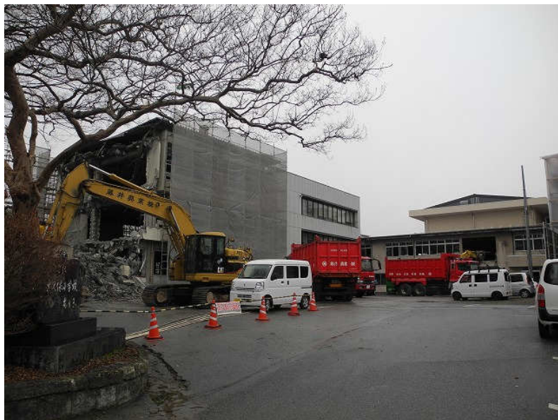
2月 水道環境棟・建設部棟解体工事