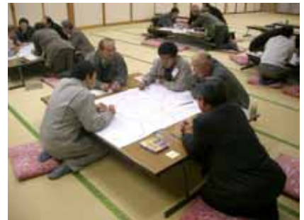
各班ごと意見を出し合っています