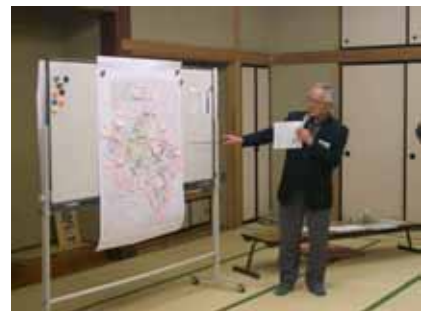
各班ごと発表しました