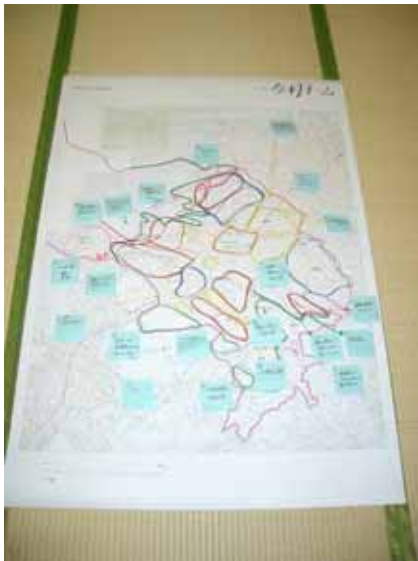
1班で記入した地図

記入をしながら、伊賀良地区の現状について議論しました(地図に記入された主な意見は裏面のとおり)。