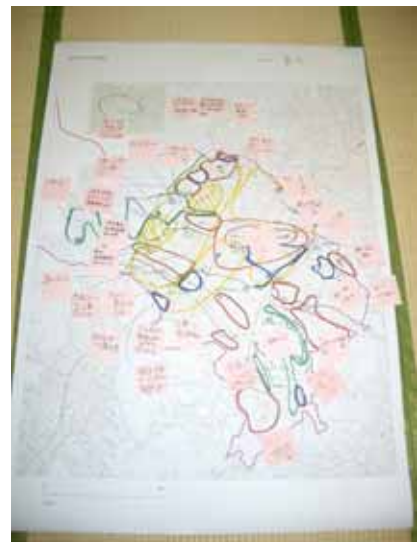
4班で記入した地図