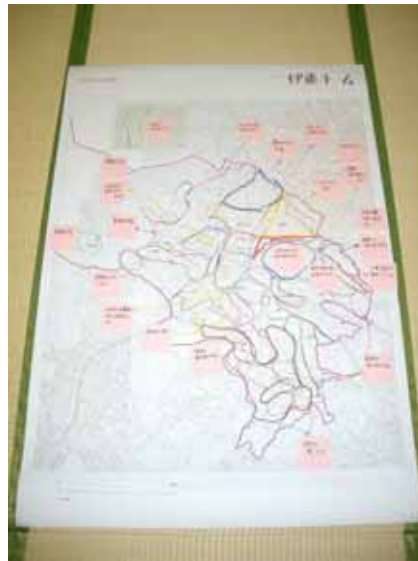
2班で記入した地図